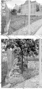
Area O (2)