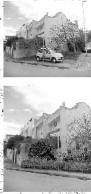
Area P (3)